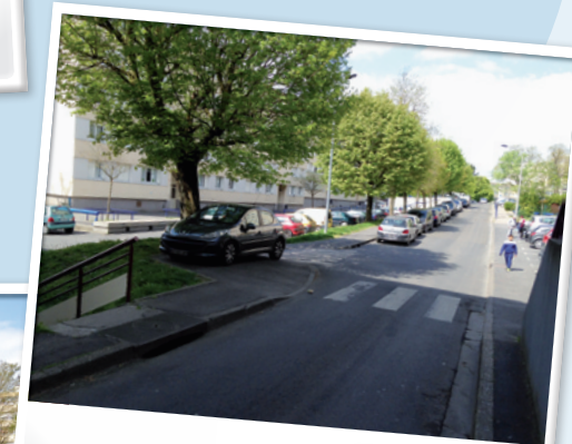
Avenue Gabriel Péri avec un travail à venir sur le stationnement.