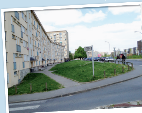
Avenue Anatole France, avec la reprise des espaces publics

Des permanences seront également organisées au cœur du quartier par les techniciens de la ville afin de vous informer au mieux de l'avancée de ce nouveau projet et de recueillir vos attentes et idées.