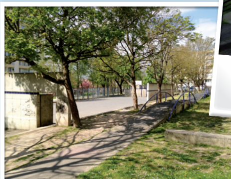
Cœur de quartier