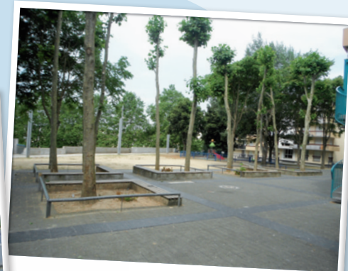
Esplanade Fernand Tuil, face au Centre Social Huberte d'Hoker